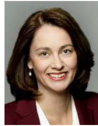
Dr. Katarina Barley